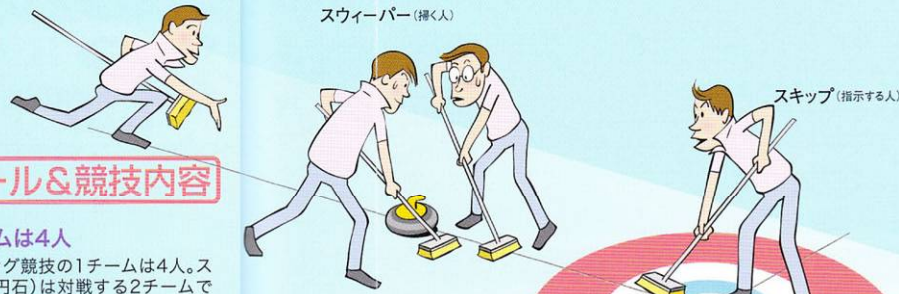
スウィーパー(掃く人)