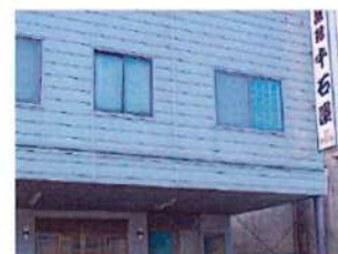
千石屋旅館 名寄市大通南9丁目 TEL.(01654)2-3254