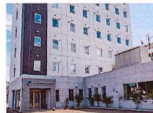
HOTEL MYSTAYS 名寄 名寄市西3條南5丁目 TEL.(01654)8-8100