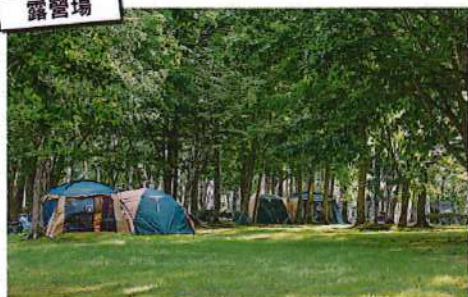
風連望湖臺自然公園露營場 名寄市風連町池之上165 TEL.(01655)3-2755

小木屋3棟、附電源的汽車露營場20格、自由帳篷區可容納100頂帳篷。忠烈布湖展開在眼前，隨著季節變化露營場內開著不同的花朵，這裡的自然環境不經雕琢保持純天然。