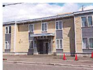
B&B Hotel Bird Inn 名寄市西2條南4丁目 TEL.(01654)9-4567