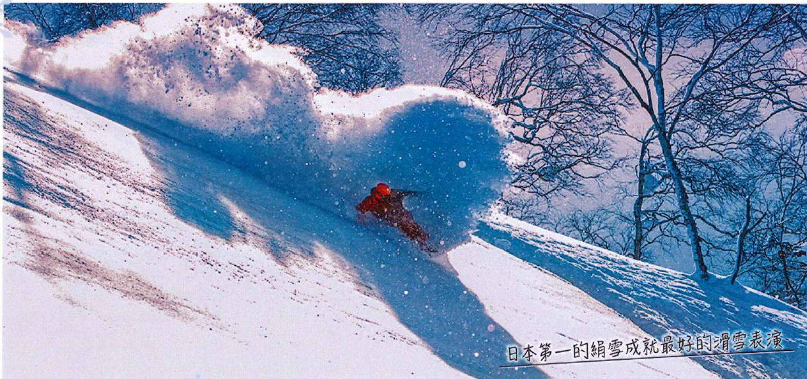
日本第一的絹雪成就最好的滑雪表演