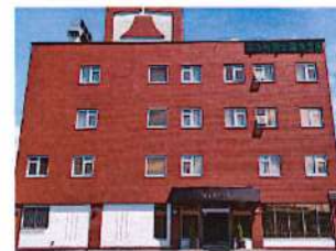
新富士屋飯店 名寄市大通南5丁目 TEL.(01654)2-2167