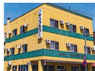
向日葵飯店 名寄市大通南8丁目 TEL.(01654)3-2929