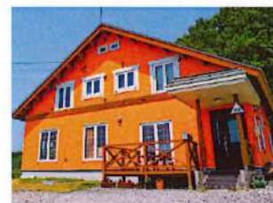
名寄太陽光柱青年旅館 名寄市日進391-2 TEL.(01654)2-2921