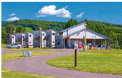
森林渡假村汽車露營場 名寄市日進147-2 TEL.(01654)3-9555

小木屋3棟、附電源的汽車露營場20格、自由帳篷區可容納100頂帳篷。忠烈布湖展開在眼前，隨著季節變化露營場內開著不同的花朵，這裡的自然環境不經雕琢保持純天然。