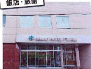
格蘭飯店藤花 名寄市西5條南4丁目 TEL.(01654)3-2323