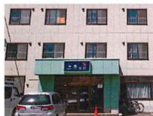
二条旅館 名寄市西2條南5丁目 TEL.(01654)3-1117